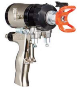
Belső keveréses levegő öblítéses Fusion™ pisztoly