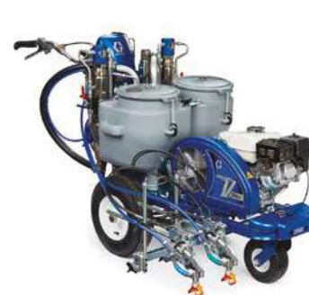
LineLazer™ V 200DC Standard